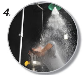
4. ใช้งานได้ครอบคลุม ทั้งการชำระล้างร่างกาย และดวงตา