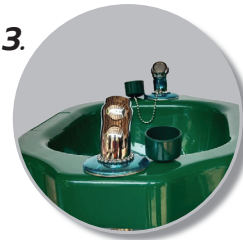
3. มีกรองฝุ่น และฝาปิด ที่วาล์วล้างตาในตัว