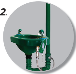
2. โครงสร้างทำมาจาก พลาสติก ABS แข็งแรง ไม่เป็นสนิม